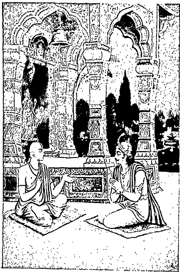
भक्त विष्णुचित्त और उनके शिष्य नरपति